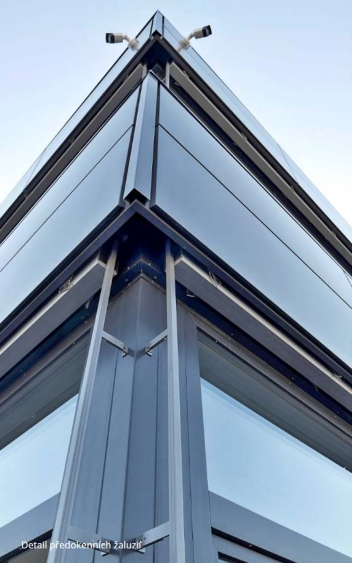
Detail předokenních žaluzií