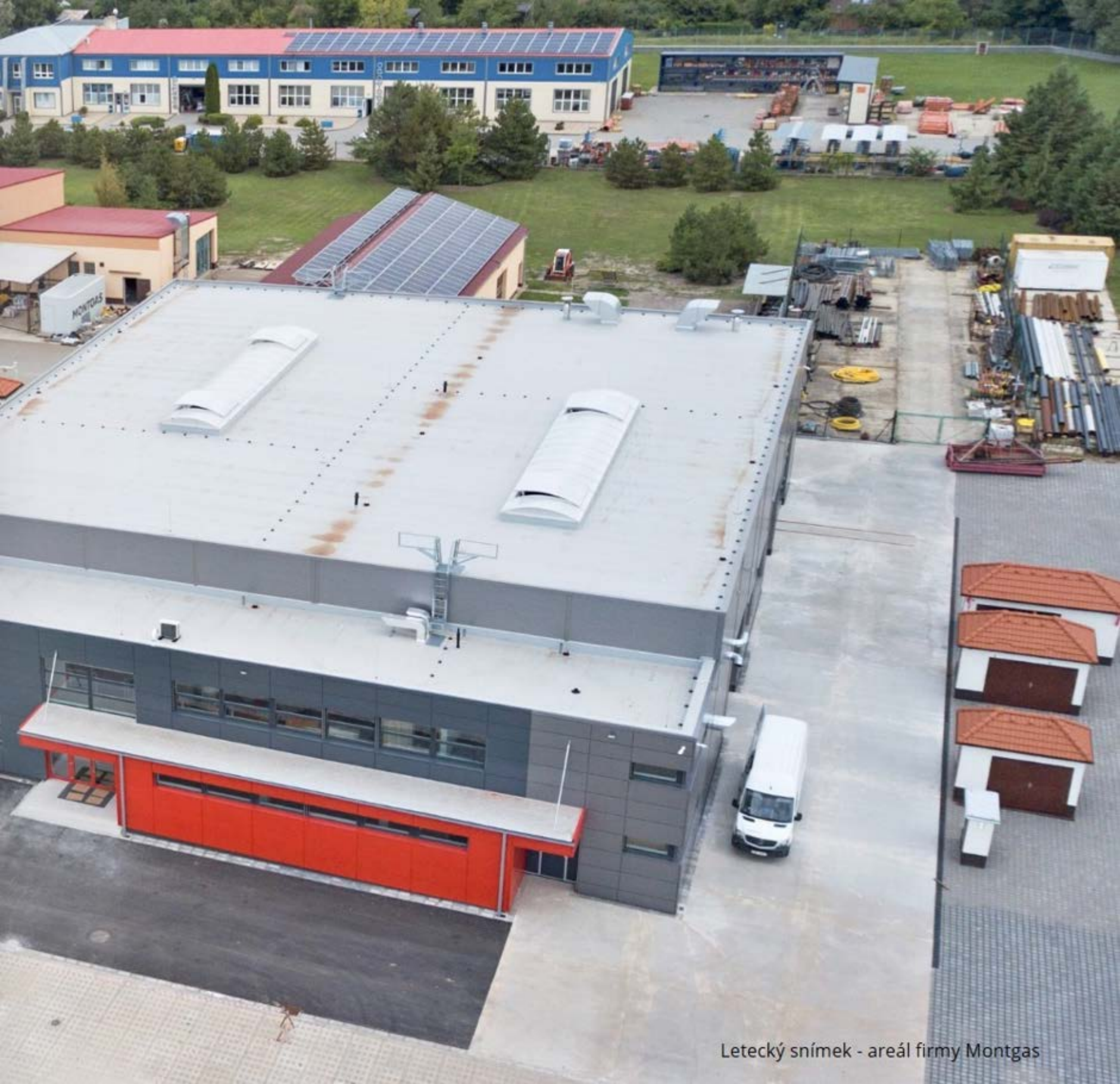
Letecký snímek - areál firmy Montgas