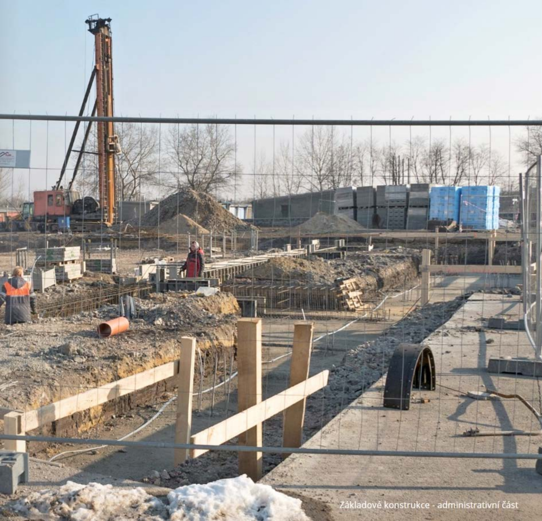
Základové konstrukce - administrativní část