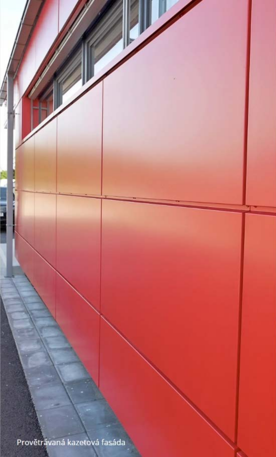
Provětrávaná kazetová fasáda