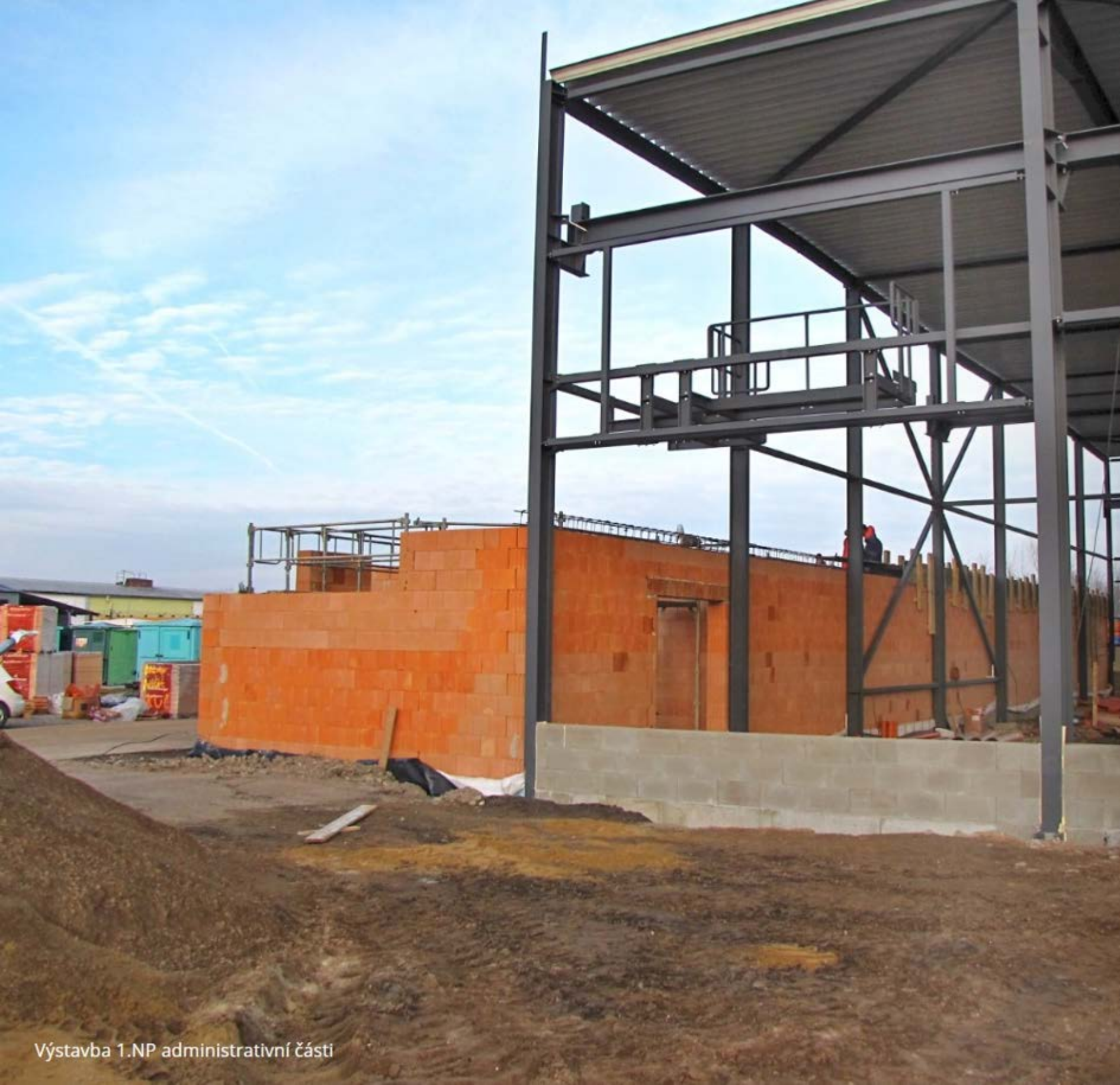
Výstavba 1.NP administrativní části