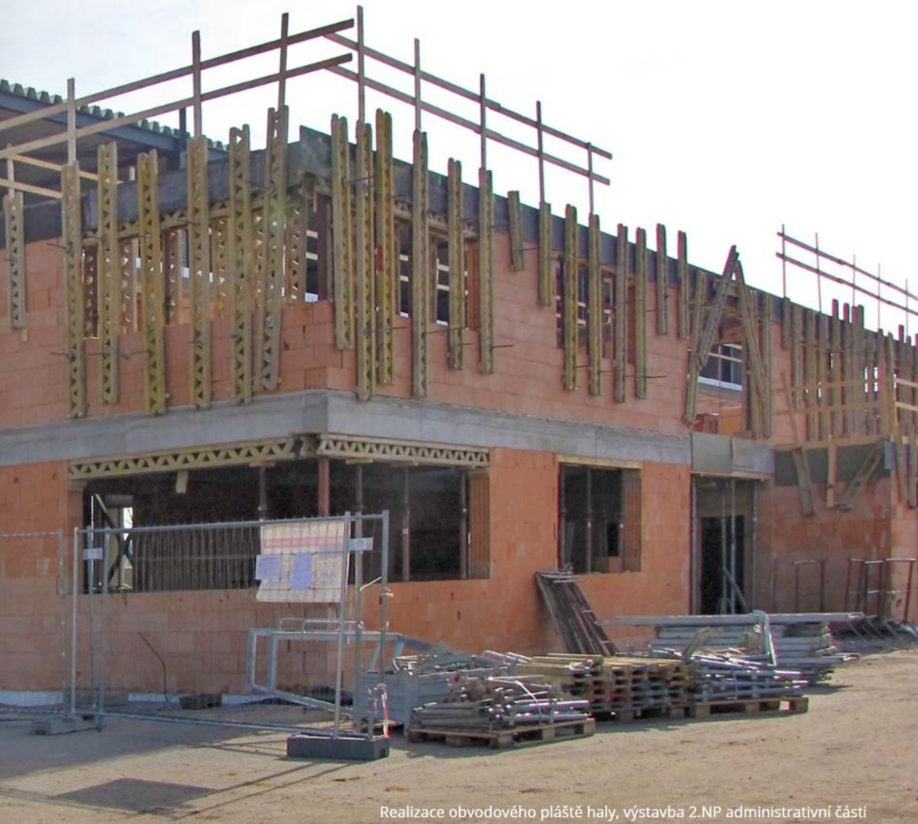
Realizace obvodového pláště haly, výstavba 2.NP administrativní části