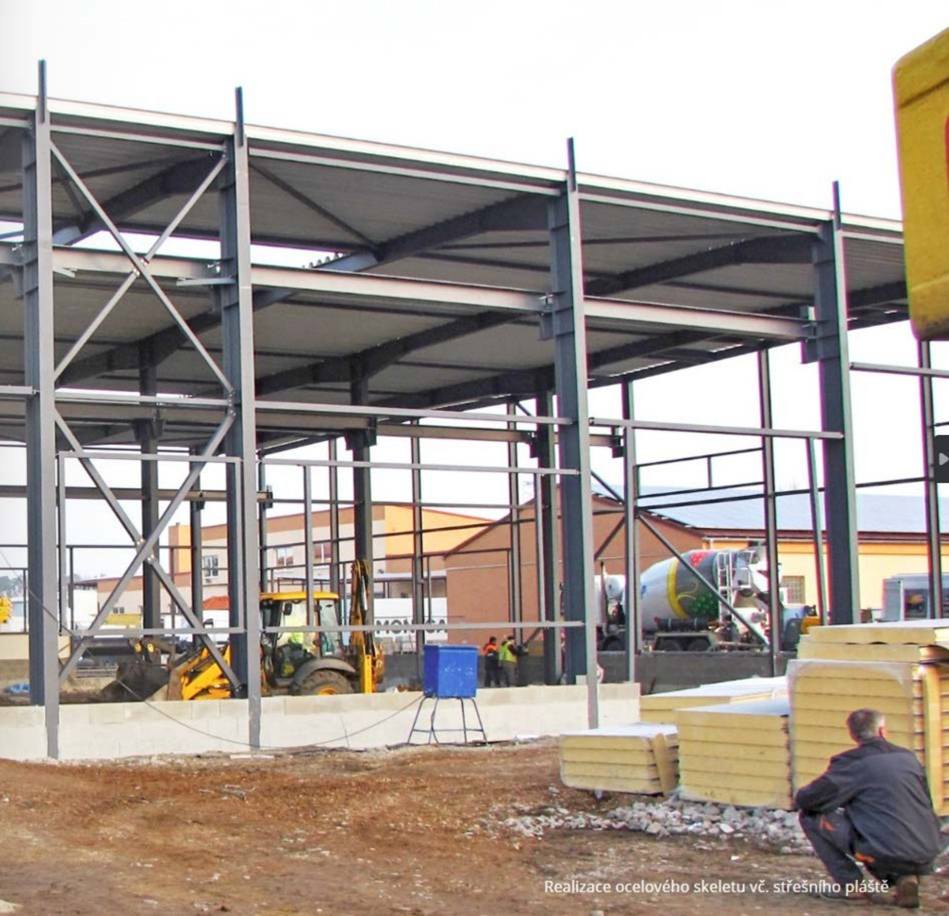
Realizace ocelového skeletu vč. střešního pláště