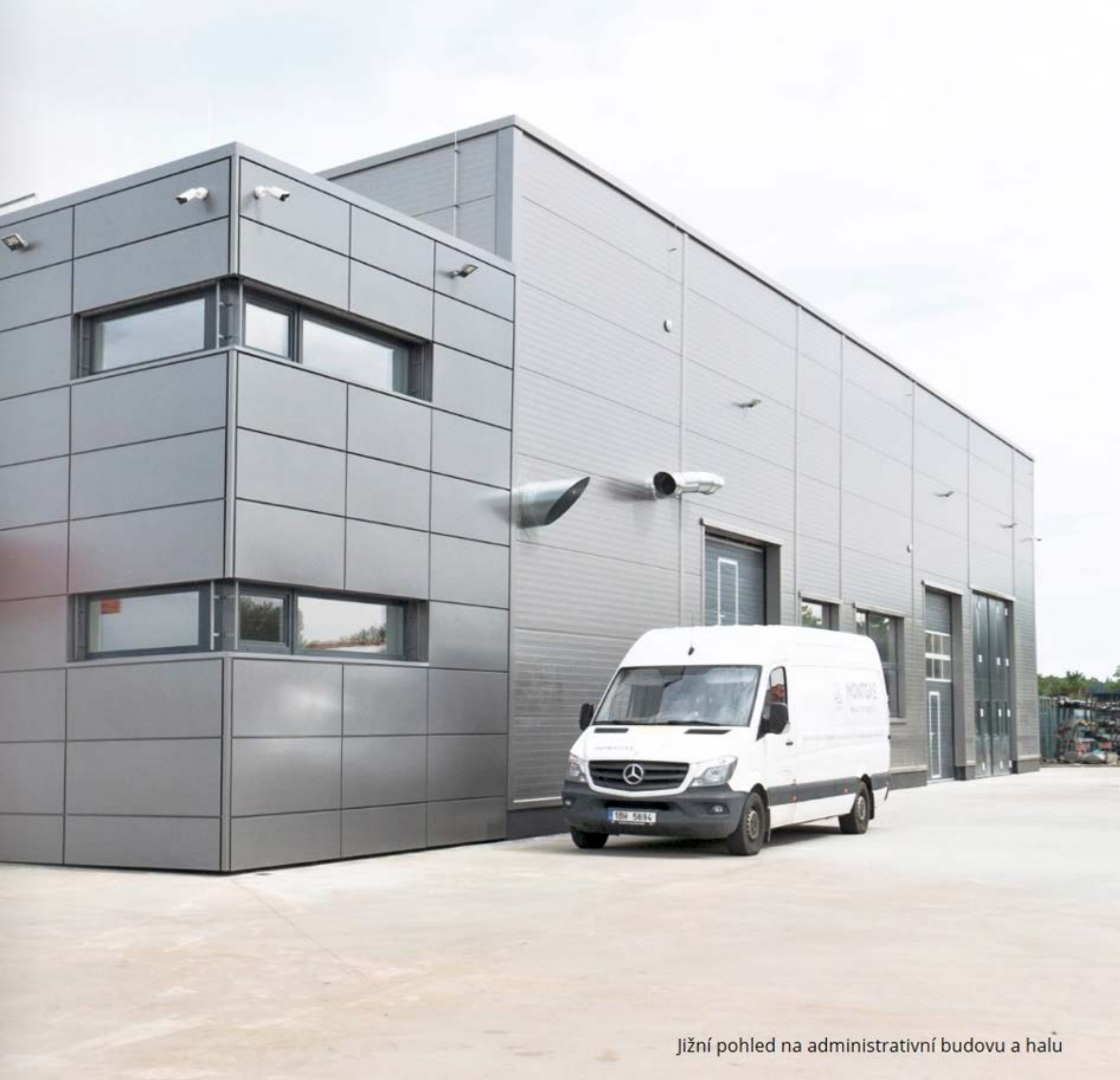
Jižní pohled na administrativní budovu a halu