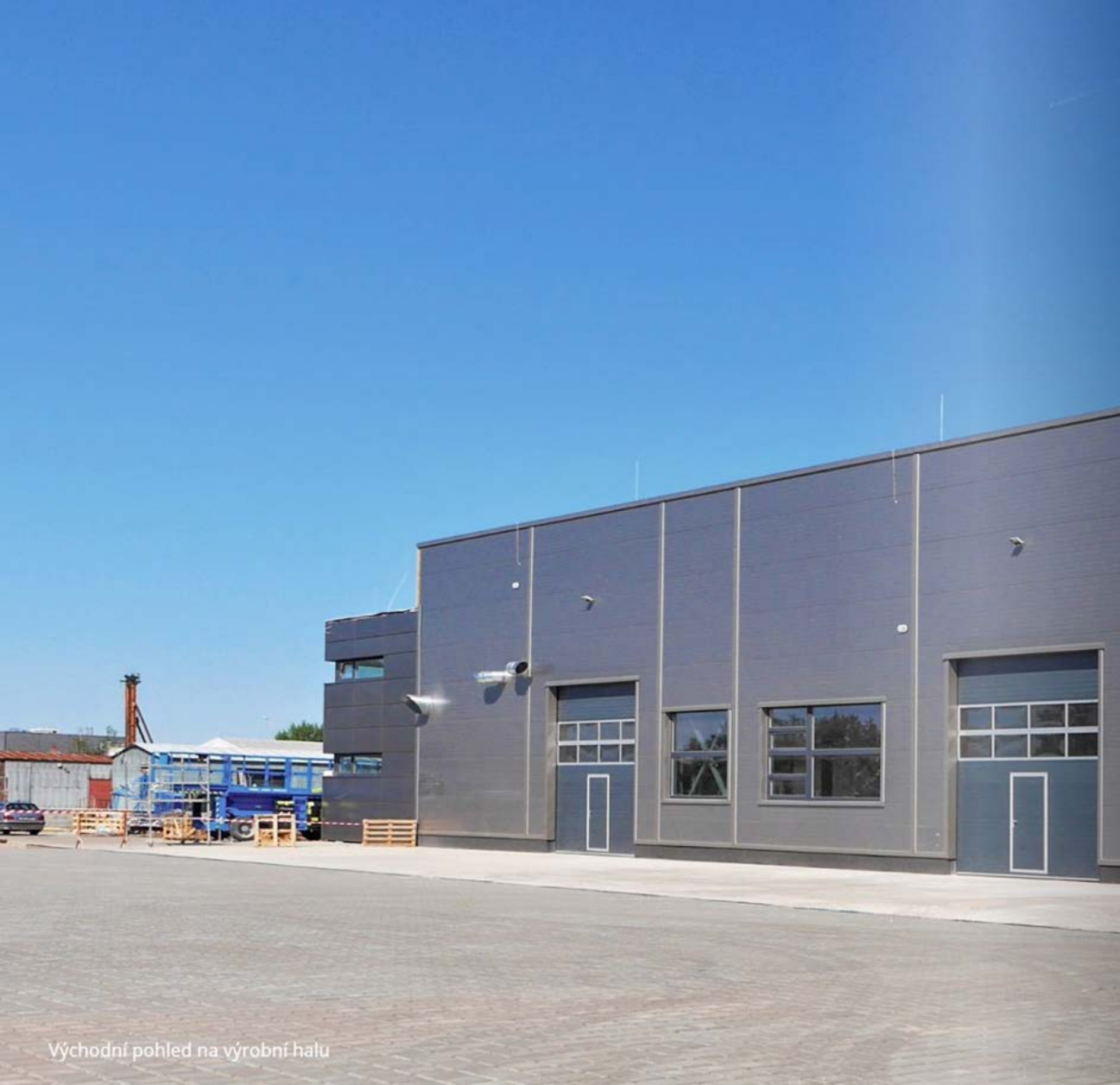
Východní pohled na výrobní halu