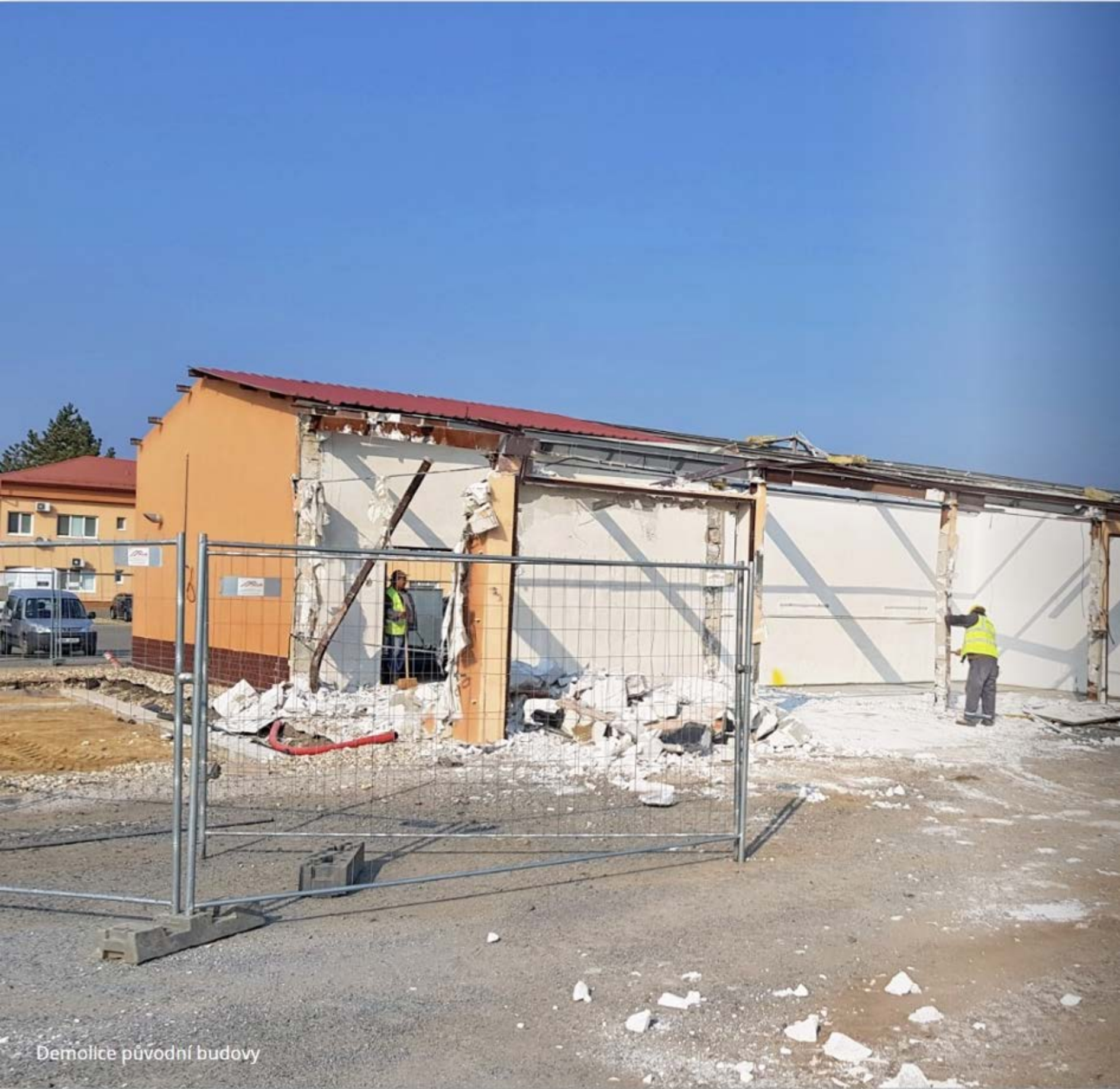
Demolice původní budovy