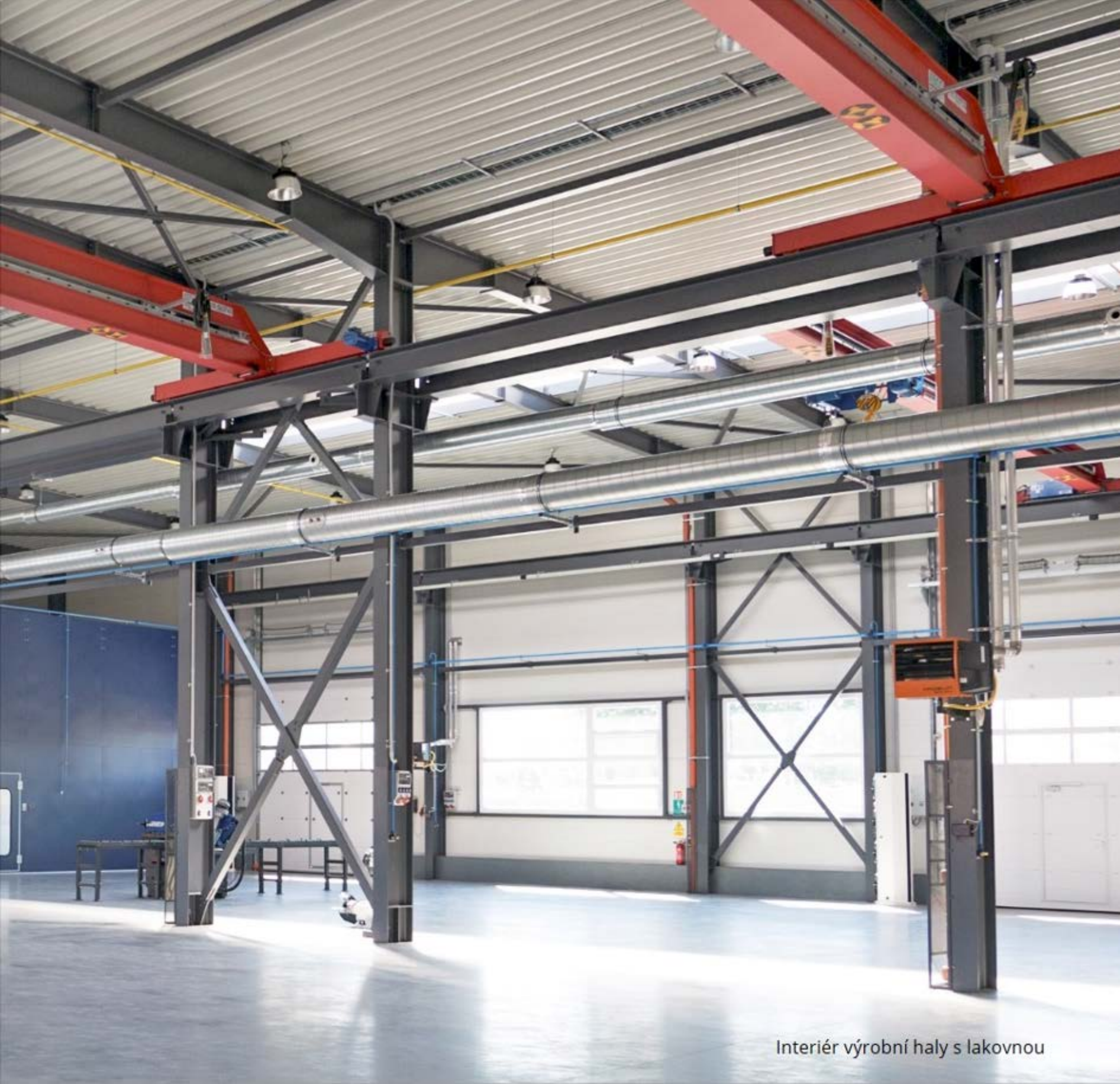
Interiér výrobní haly s lakovnou