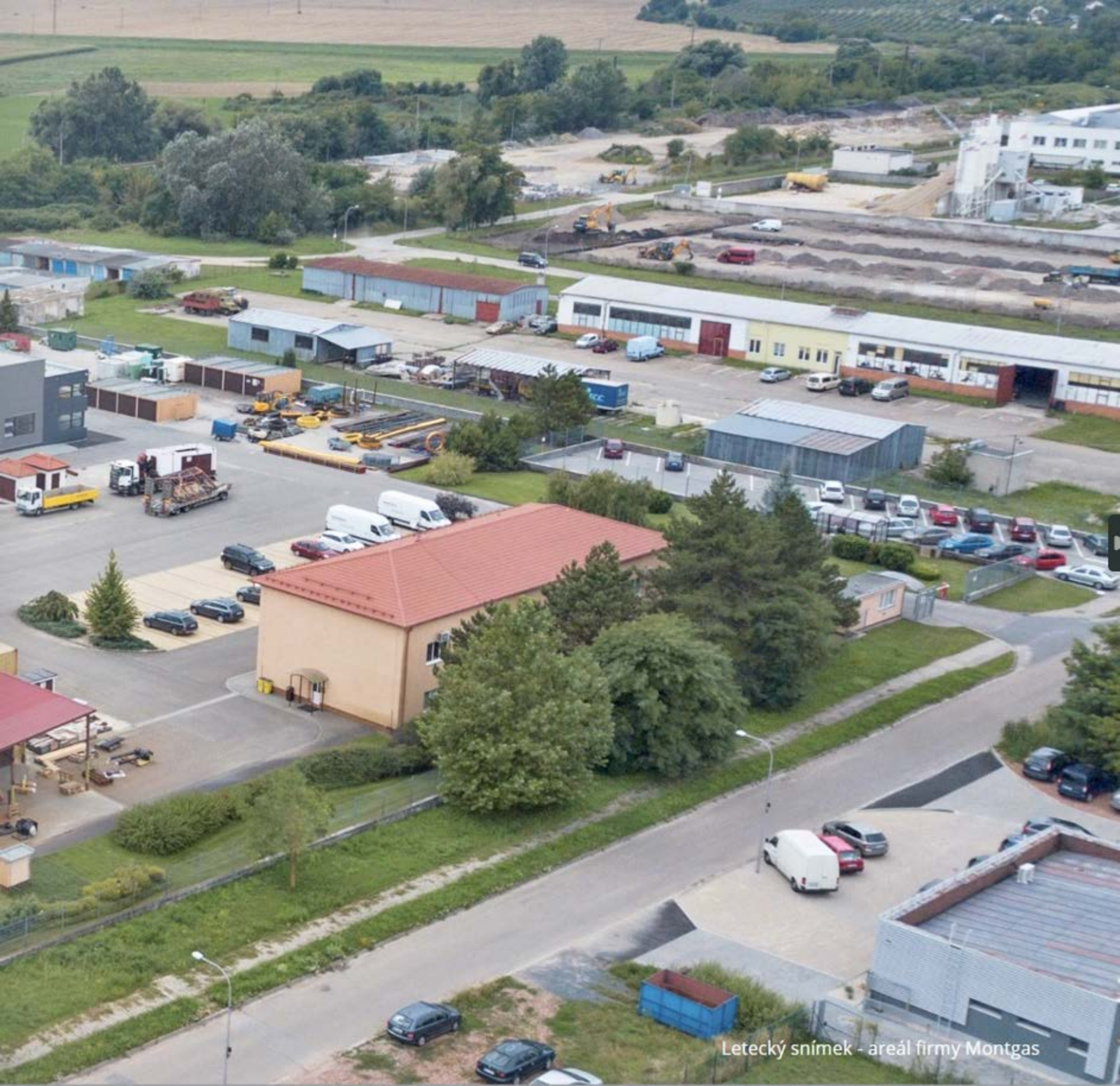
Letecký snímek - areál firmy Montgas