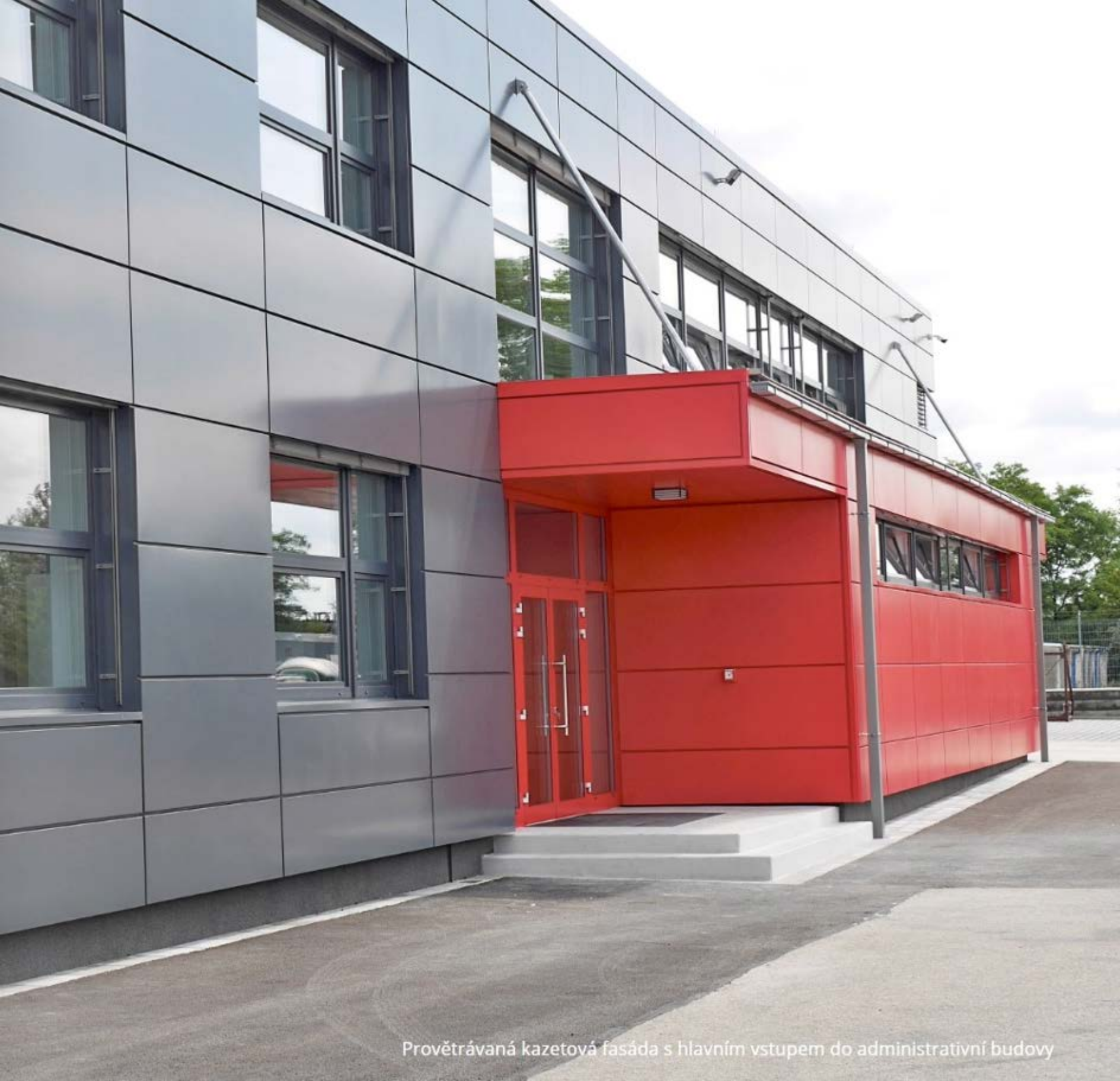
Provětrávaná kazetová fasáda s hlavním vstupem do administrativní budovy