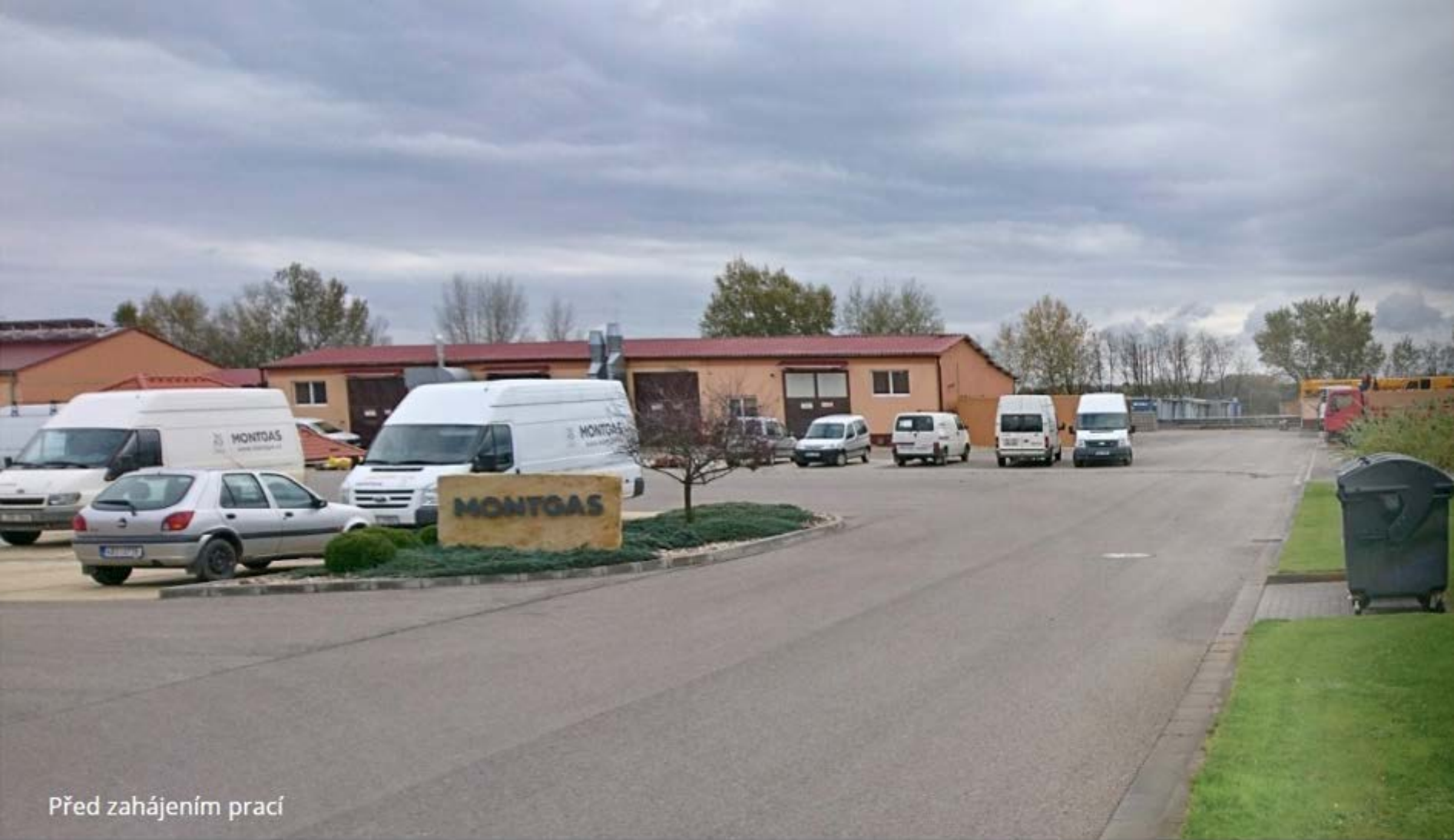
Před zahájením prací